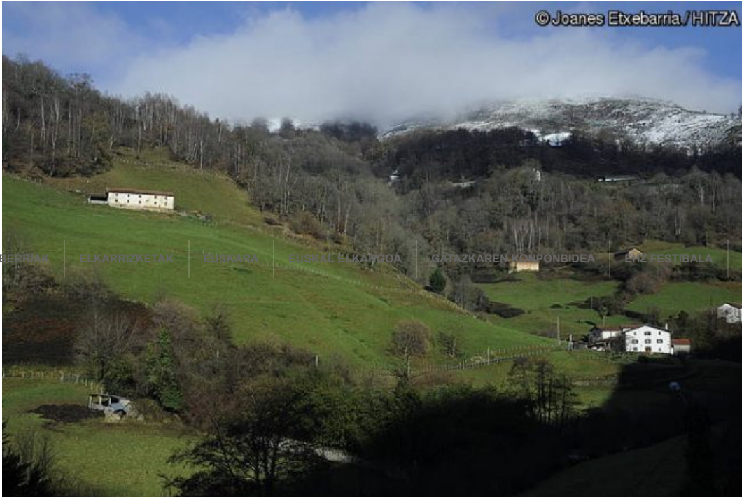
Joanes Etxebarria abendua 15, 2017